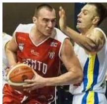
DESIO - BALTUR BASKET VITTORIA CON AFFANNO: AURORA DESIO - BALTUR CENTO 68-71 !

FUTURO DELLE BANCHE IN ITALIA ED IN EUROPA ..ARRIVANO ALCUNE CONSIDERAZIONE DAL COMITATO PICCOLI AZIONISTI CARICENTO !